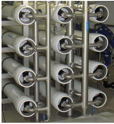
Châssis d'osmose inverse