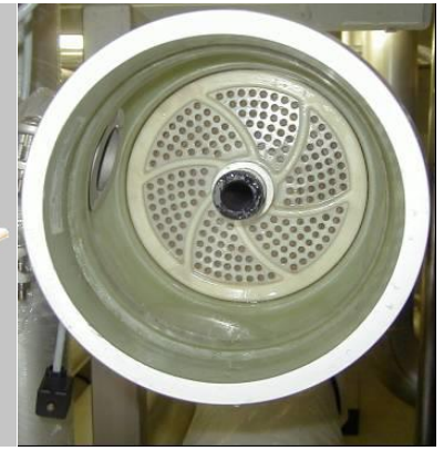
Détail d'un tube à pression